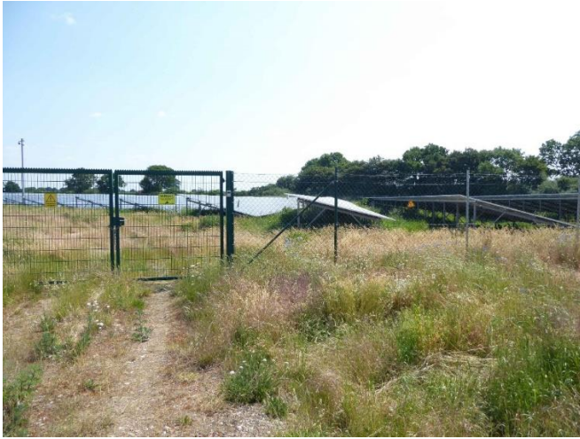
Abb. 5: Zäune verstärken den technischen Charakter von Solarparks. Mit einer Bepflanzung aus standortheimischen Gehölzen könnten die negativen Auswirkungen auf das Landschaftsbild deutlich reduziert oder vollständig behoben werden. Im vorliegenden Beispiel scheint der Platz für eine solche Anpflanzung durchaus vorhanden zu sein.