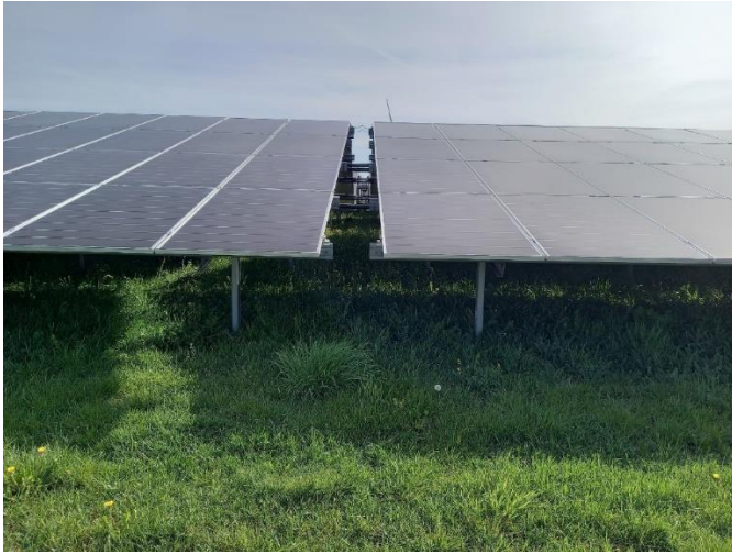
Abb. 8: Solarparks sollten möglichst nur auf Flächen mit Biotoptypen der Wertstufen I und II errichtet und so geplant werden, dass darin Biotoptypen mindestens der Wertstufe III erreicht werden und diese mindestens ein Drittel des Solarparks einnehmen. Auf diese Weise kann am ehesten ein Ausgleich versiegelungs- und beschattungsbedingter Beeinträchtigungen von Boden und Biotopen innerhalb des Solarparks erreicht werden.