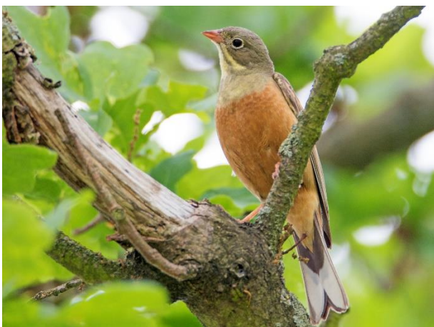
Abb. 12: Der Ortolan mag die Module von Solarparks vereinzelt als Singwarte nutzen können, aber die darin entstehenden Grünlandbiotope eignen sich für diese Vogelart weder als Brut- noch als Nahrungshabitat.