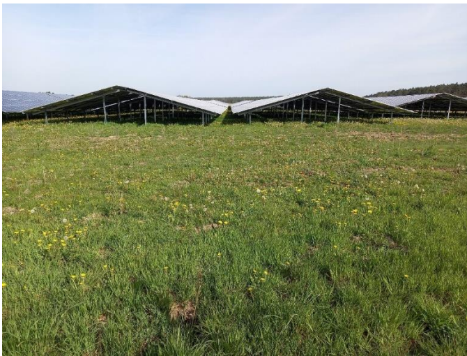
Abb. 9: Unter den Modulen sind Kompensationsmaßnahmen kaum möglich. Die geringen Reihenabstände sind für Kompensationsmaßnahmen unzureichend. Die in den Solarpark insgesamt einbezogene Fläche bietet aber möglicherweise ein ausreichendes Aufwertungspotential, um dort die für Naturhaushalt und Landschaftsbild geschuldete Kompensation zu erbringen.