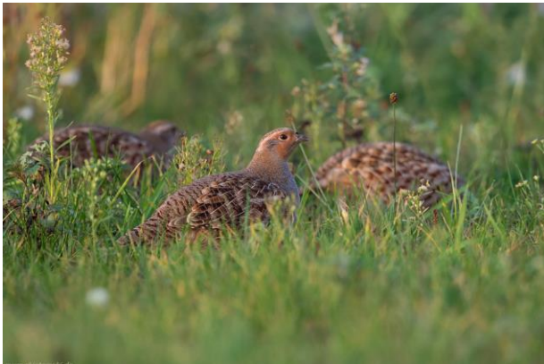
Abb. 11: Das Rebhuhn profitiert von wildkraut- und insektenreichen Grünlandbiotopen, Brachen und Gehölzen. Solche Habitats können in Solarparks durchaus entwickelt werden. Dafür ist es allerdings für die bodennah orientierte Vogelart wichtig, dass Zäune ihr den Zugang in diese Habitate nicht versperren und ein ausreichender Freiraum zwischen den Modulreihen eingerichtet wird.