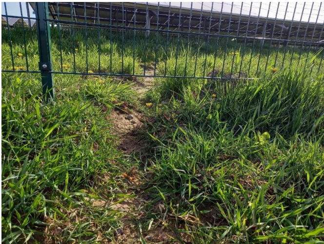
Abb. 6: Zwischen Grundfläche und Zaun passt immerhin ein Fuchs. Die Durchlässigkeit von Zäunen für wildlebende Tierarten sollte planerisch gewährleistet werden und nicht dem Zufall überlassen bleiben.