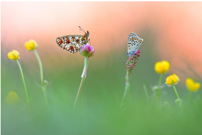
Abb. 14: Gerade nährstoffarme Biotoptypen der Heiden und Magerrasen und deren Lebensgemeinschaften könnten bei einer an den Zielen des Biotop- und Artenschutzes angepassten Pflege in Solarparks entwickelt werden.