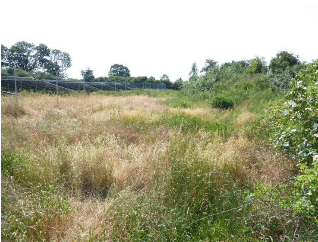
Abb. 3: Der Gehölzstreifen rechts im Bild trägt zu einer Eingrünung der FF-PV bei. Der Abstand der Gehölze ist so groß, dass der Energieertrag der Anlagen nicht durch Schattenwurf gemindert wird. Die Fläche zwischen Anlagen und Gehölzen kann zu wertvollen Biototypen entwickelt und so die mit den Modulen für Boden und Biotope verbundenen erheblichen Beeinträchtigungen der Leistungs- und Funktionsfähigkeit des Naturhaushalts kompensiert werden.