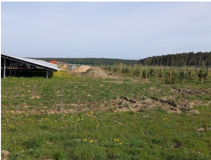
Abb. 18: FF-PV und mit einer noch jungen Anpflanzung von Bäumen und (im Vordergrund) Sträuchern zur landschaftsgerechten Wiederherstellung des Landschaftsbildes.

Unter Umständen können auch der Abbau oder die Eingrünung vorhandener, das Landschaftsbild störender oder beeinträchtigender baulicher Anlagen zur geschuldeten Kompensation beitragen, wenn diese Maßnahmen in demselben Landschaftsbildraum erfolgen, der von den FF-PV optisch in Mitleidenschaft gezogen wird. Diese Maßnahmen sind insbesondere in Offenlandschaften zweckmäßig, in denen Gehölzpflanzungen ausscheiden, weil der Offenlandcharakter aus Gründen des Naturschutzes und der Landschaftspflege bewahrt werden soll (z.B. in Wiesen- vogelgebieten). In Offenlandschaften der Küsten und Marschen kann die Anlage wasserführender und mit Röhricht bestandener Gräben zur Integration der FF-PV beitragen.