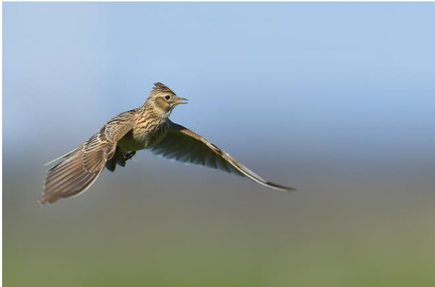
Abb. 10: Feldlerchen halten zu vertikalen Strukturen wie Bäumen und Bauwerken Abstände. Dass Feldlerchen in Solarparks erfolgreich brüten können, ist auch deshalb wenig wahrscheinlich, weil Prädatoren die Anlagen als Ansitzwarte für die Jagd nutzen können.

Innerhalb von Solarparks kann insbesondere für die meisten Feldvogelarten sowie den Feldhamster keine Kompensation erwartet werden, weil diese Arten Abstände zu den Anlagen halten oder dort einer erhöhten Prädation durch Fressfeinde ausgesetzt sind, welche die Anlagen u.U. als Ansitzwarte für die Jagd nutzen. 23 Diese Umstände können Kompensationsmaßnahmen außerhalb des Solarparks erfordern.