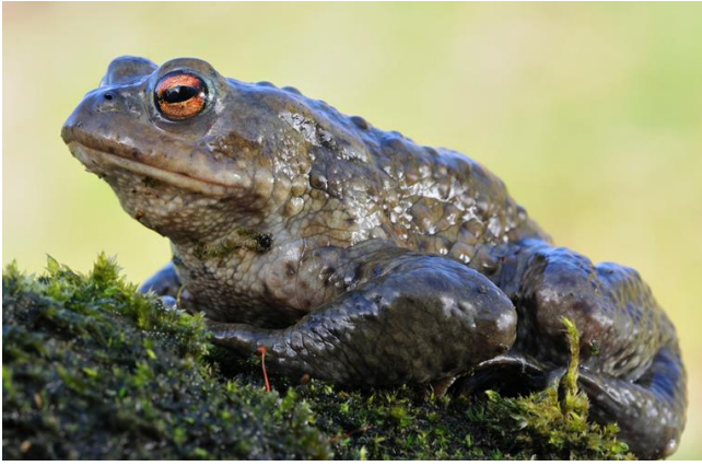
Abb. 13: Niederschlagswasser könnte in Solarparks für die Entwicklung von feuchten Standorten und Tümpeln genutzt werden. Für eine erfolgreiche Reproduktion von Erdkröten müssen die Kleingewässer aber ausreichend besonnt sein.