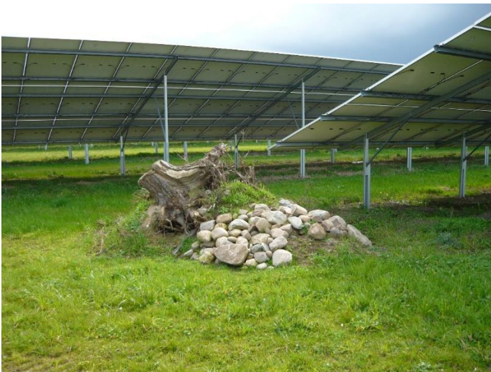
Abb. 17: Totholz- und Lesesteinhaufen – gut gemeint, aber auch gut gemacht? Freiflächen in Solarparks sollten möglichst naturnah gestaltet werden, aber nicht zu einem Freilandzoo oder botanischen Garten.