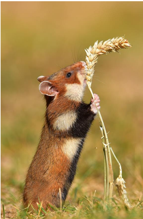
Abb. 15: In den Lebensräumen des vom Aussterben bedrohten Feldhamsters sollten keine Solarparks errichtet werden. Selbst wenn die Freiflächen zwischen den Anlagenreihen als Kompensationsflächen feldhamstergerecht bewirtschaftet würden, wären diese eher eine ökologische Falle, weil Greifvögel die Module als Ansitzwarte für die Jagd nutzen können.