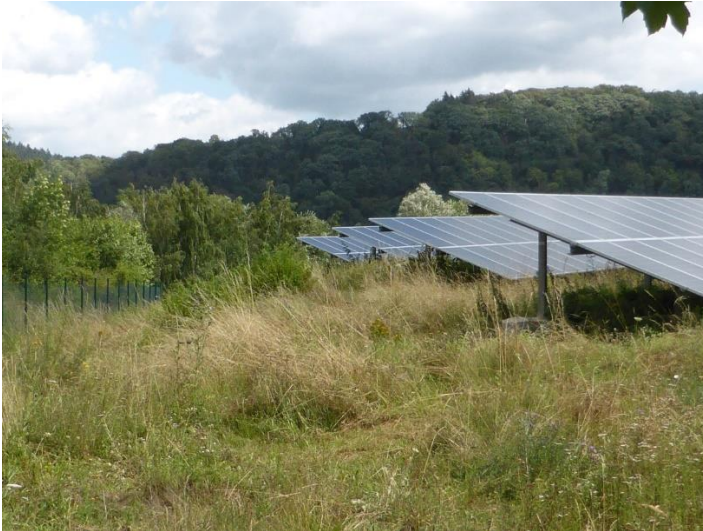
Abb. 16: Beispiel für eine gut in die Umgebung integrierte FF-PV. Die Freiflächen können sich naturnah entwickeln; sie werden einmal jährlich gemäht. Das Mähgut wird abtransportiert.