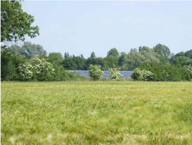
Abb. 2: Mit der Standortwahl der FF-PV wurde vom Aufnahmestandort aus betrachtet eine Integration in das Landschaftsbild ohne Neuanpflanzungen erreicht.