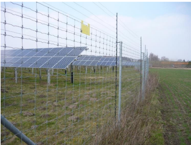
Abb. 4: FF-PV ohne Maßnahmen des Naturschutzes und der Landschaftspflege, welche die mit den Anlagen verbundenen erheblichen Beeinträchtigungen des Landschaftsbildes kompensieren könnten. Die Fläche entlang des Zaunes innerhalb der Anlage dürfte für die Anpflanzung von Gehölzen, die zu einer landschaftsgerechten Wiederherstellung führen könnten, kaum genügen. Problematisch ist zudem die Einzäunung. Sie reicht bis auf den Boden und umfasst auch einen Elektrozaun. Selbst für ein Kaninchen gibt es kein Durchkommen.